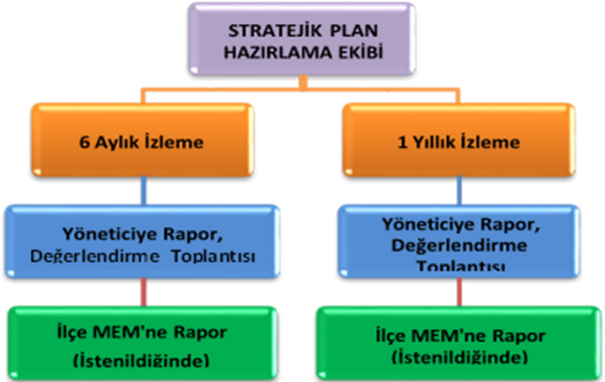
Şekil 3: İzleme ve Değerlendirme Süreci

Müdürlüğümüzün 2024-2028 Stratejik Planı İzleme ve Değerlendirme sürecini ifade eden İzleme ve Değerlendirme Modeli hazırlanmıştır. Müdürlüğümüzün Stratejik Plan İzleme- Değerlendirme çalışmaları eğitim-öğretim yılı çalışma takvimi de dikkate alınarak 6 aylık ve 1 yıllık sürelerde gerçekleştirilecektir. 6 aylık sürelerde rapor hazırlanacak ve değerlendirme toplantısı düzenlenecektir. İzleme-değerlendirme raporu, istenildiğinde İlçe Mil i Eğitim Müdürlüğü'ne gönderilecektir. Ayrıca ilçemizin Mülki İdari Amirine sunulacaktır. 1 yıllık izleme-değerlendirme çalışmaları, Stratejik Planımızda yer alan hedeflerin yıllık düzeyde ifade edildiği Performans Programı ve yılsonunda gerçekleşme düzeylerinin belirlendiği Faaliyet Raporu hazırlanarak yapılacaktır.